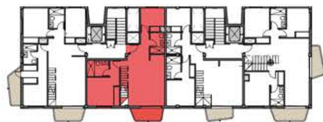
PLANTA TERCERA. SITUACION VIVIENDA EN PLANTA