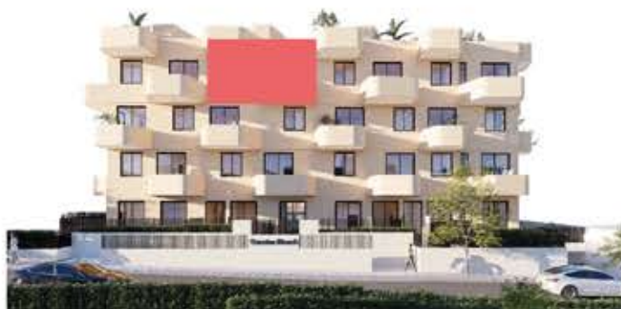
PLANTA TERCERA. SITUACION VIVIENDA EN ALZADO