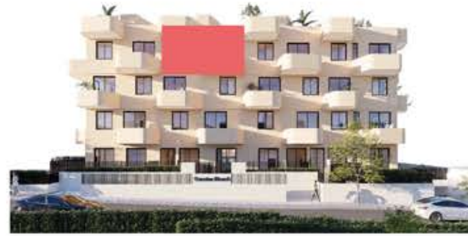
PLANTA TERCERA. SITUACION VIVIENDA EN ALZADO