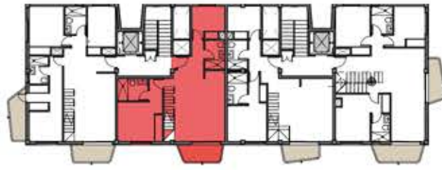
PLANTA TERCERA. SITUACION VIVIENDA EN PLANTA