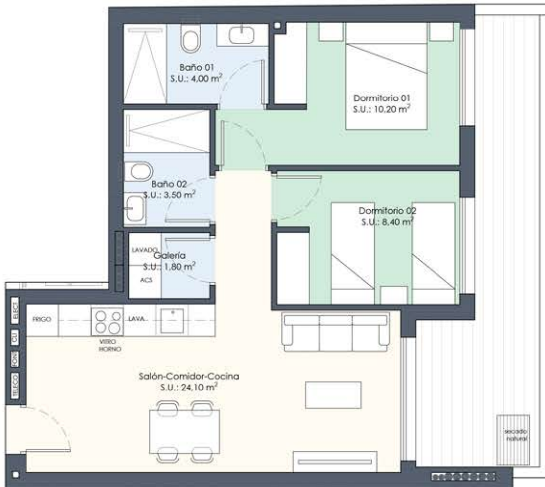
Planta Primera A B2 - 2 Dormitorios