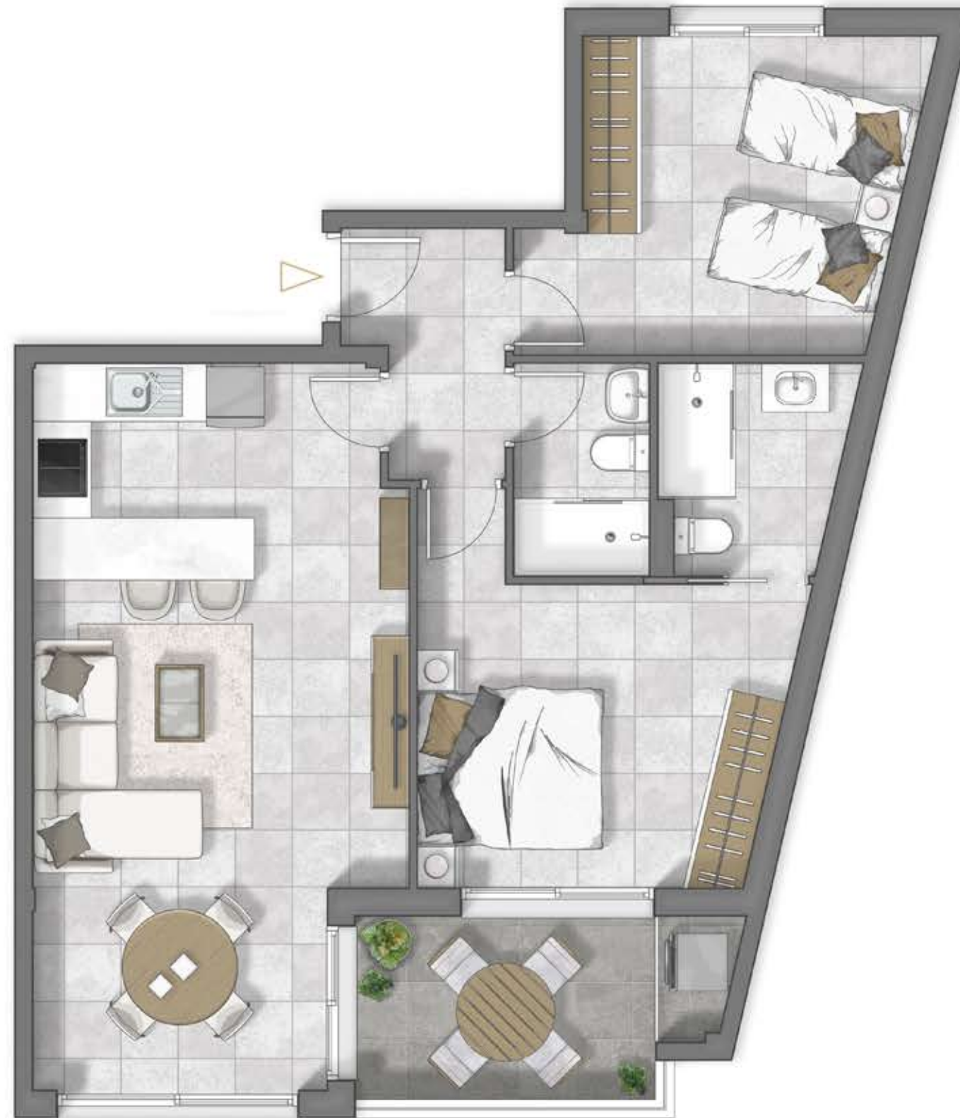
PLANTA 1º Puerta B