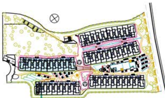
bloque 1 ordenacion general

VIVIENDA TIPO 2 dormitorios BLOQUE 1 ESCALERA 2 PLANTA PRIMERA