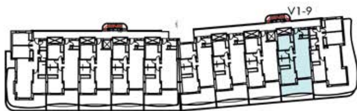
bloque 1 planta primera