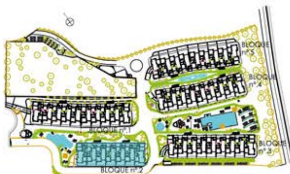
bloque 2 ordenacion general