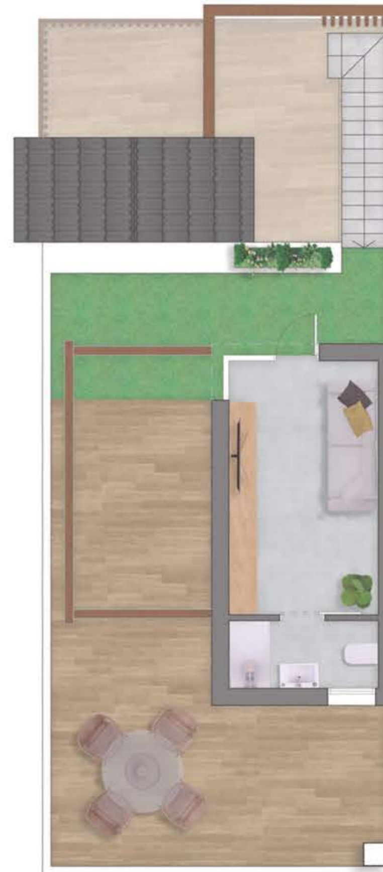
Planta solarium/ Topfloor