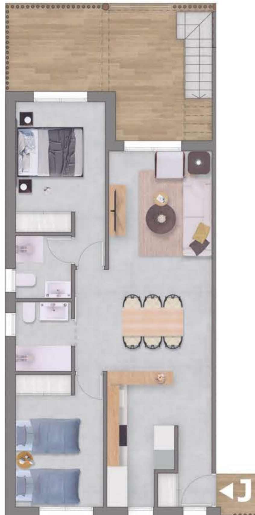
Planta primera / First Floor