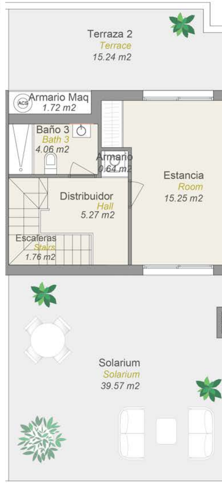
PLANTA BAJO CUBIERTA