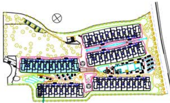
bloque 1 ordenacion general

VIVIENDA TIPO AT-4 3 dormitorios BLOQUE 1 ESCALERA 1 PLANTA ÁTICO