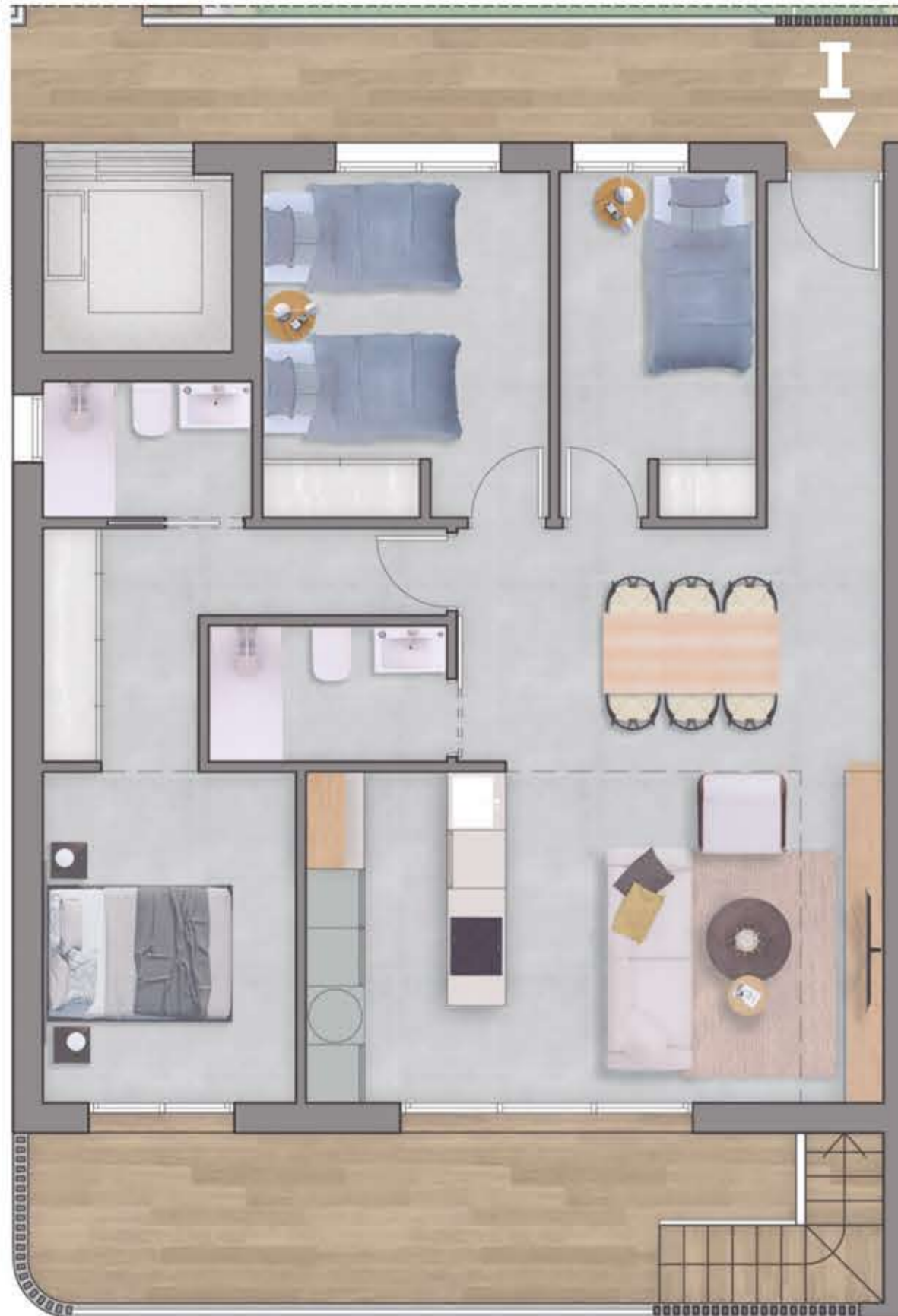
Planta primera / First Floor