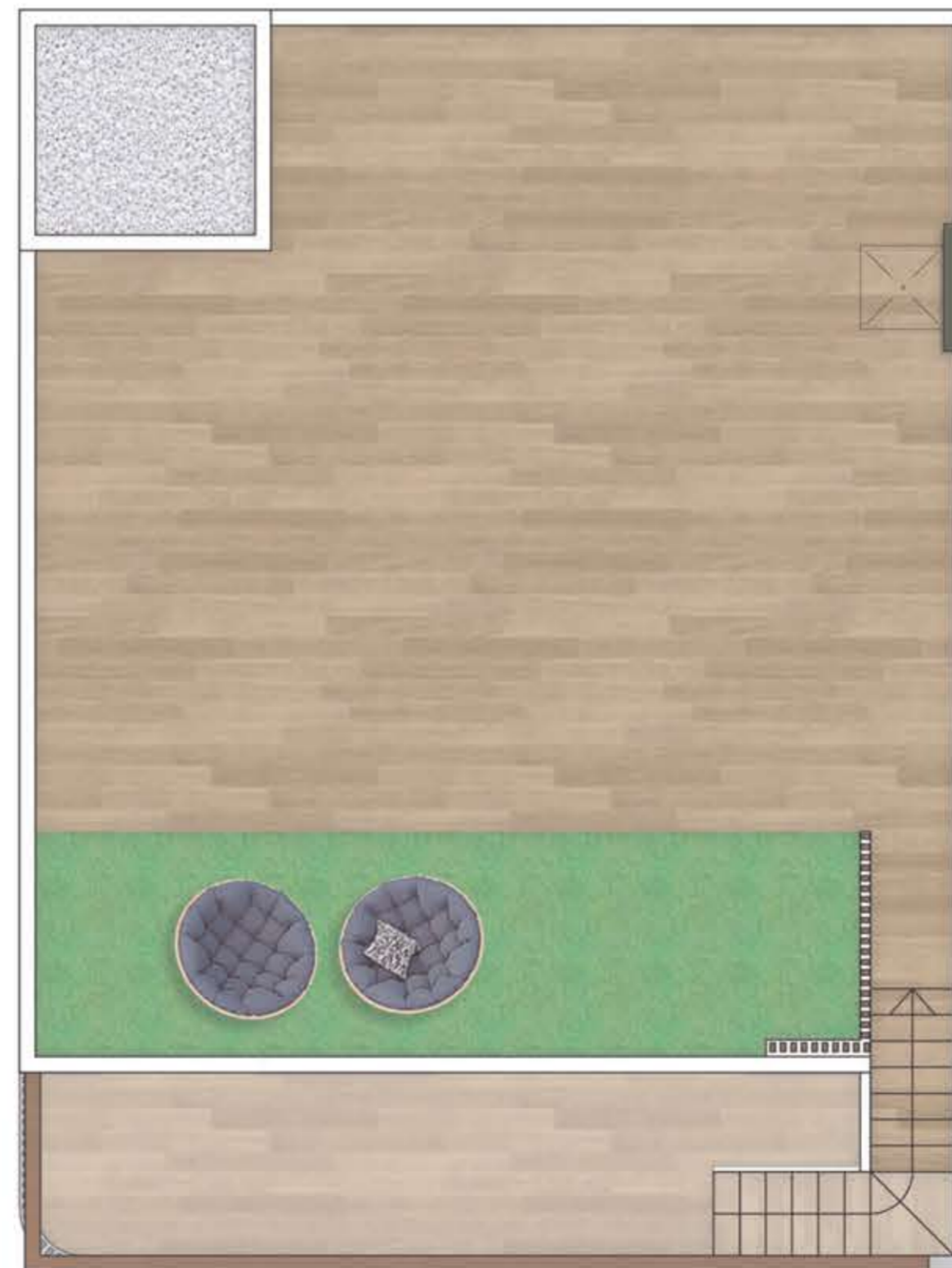
Planta solarium / Topfloor